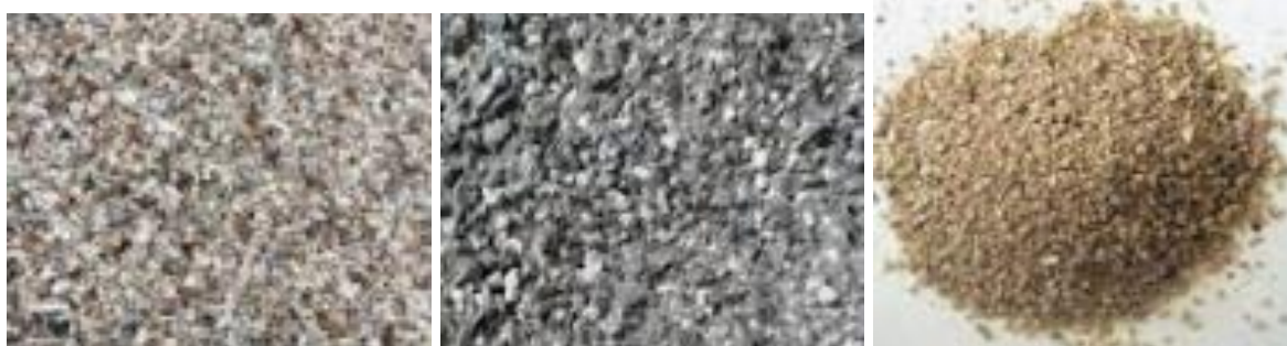
Gambar 4. Butiran agregat serpihan batuan ortoklas, felspar dan kwarsa

Berdasarkan hasil penyaringan lumpur pemboran pada kedalaman 1.785 feet yang mengalami sirkulasi ke permukaan diketahui bahwa serpihan material padat terbawa lumpur pemboran adalah material agregat halus sejenis mineral kwarsa ( \text{SiO}_2 ) dengan bentuk kristalnya khas. Sedangkan material agregat kasarnya adalah serpihan batuan berwarna putih abu-abu dan kemerah-merahan dengan bintik-bintik hitam (Gambar. 4). Diprediksi pada kedalaman 1.785 feet ini lapisan batuanya adalah batuan felspar, ortoklas dan sejenisnya dengan sifat kekerasan batuan 5-6. Dengan sifat keras batuan yang cukup keras ini maka pemboran dihentikan pada lapisan felspar dan ortoklas dengan asumsi bahwa batuan felspar dan ortoklas akan dapat menjadi tumpuan yang cukup kokoh dan stabil untuk end bearing pile foundation bangunan platform lepas pantai ( flare stack offshore platform ).