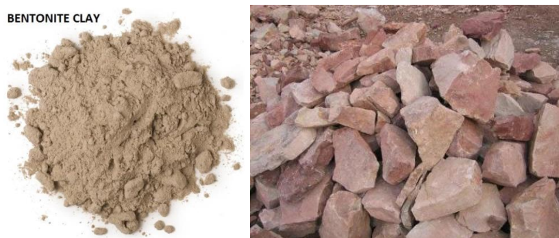
Gambar 2. Bentonite (kiri) dan Barite (kanan)